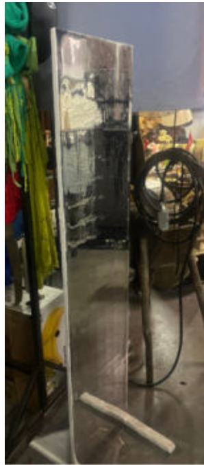
8. stehender Spiegel/standing mirror