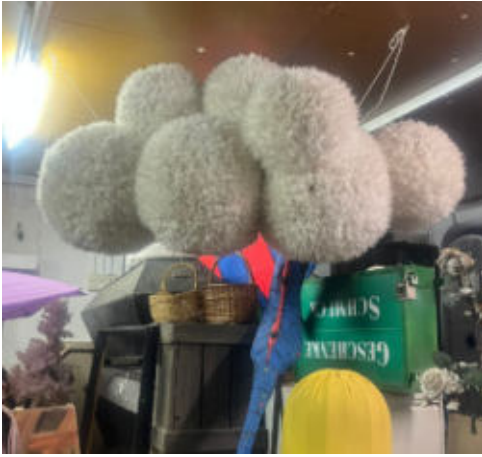
4.hängende große Wolke/large hanging cloud