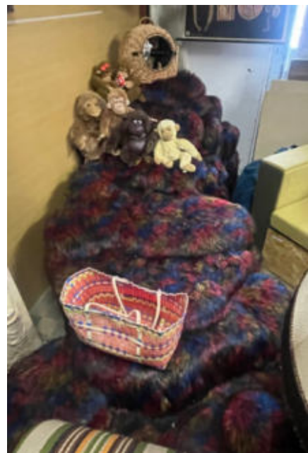
9. bewegliches Sofa/movable couch