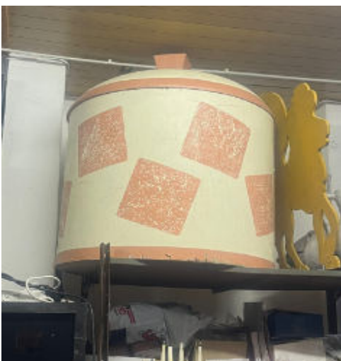
1. Riesige Dose/huge Box

The following props can be used for the entries. If you would like to pick props, make a note in your concept.