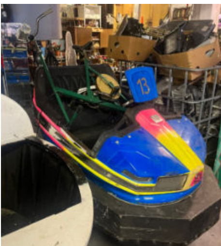
10. Autoscooter/bumper car