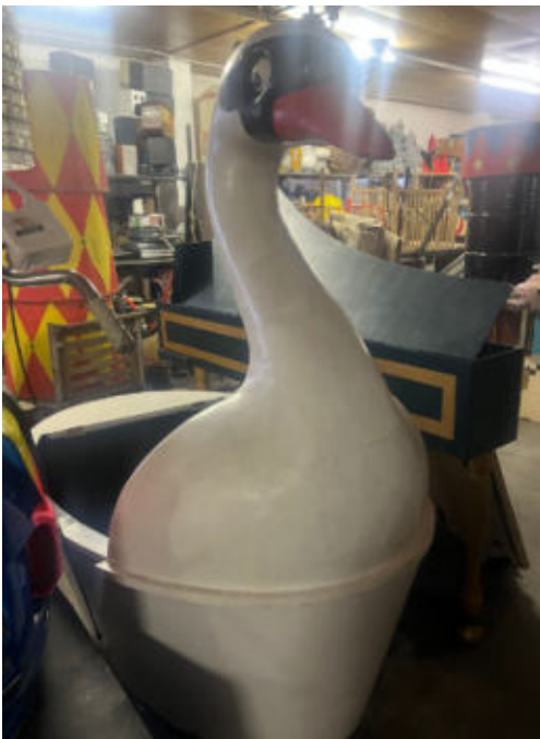
7. Schwanenboot (beweglich)/swan boat (movable)