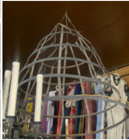
5.Reifrock aus metal/metal hoop skirt