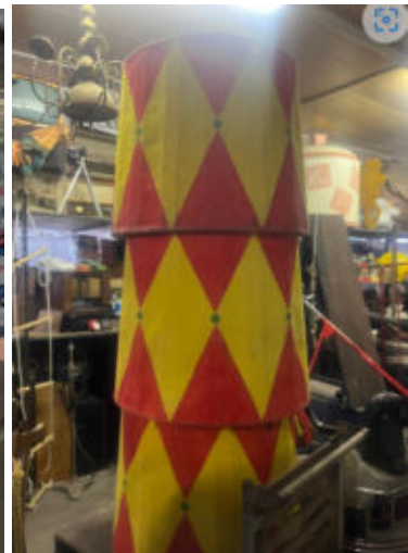
3. 3x Zirkus Podest/circus podium